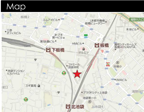
図面と現況が相違する場合は現況を優先させていただきます。

(公社)東京都宅地建物取引業協会会員 (公社)首都圏不動産公正取引協議会加盟 (公社)全国宅地建物取引業保証協会会員 東京都知事(4)80266号