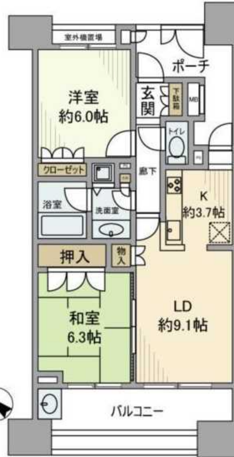
図面と現況が相違する場合は現況を優先させていただきます。