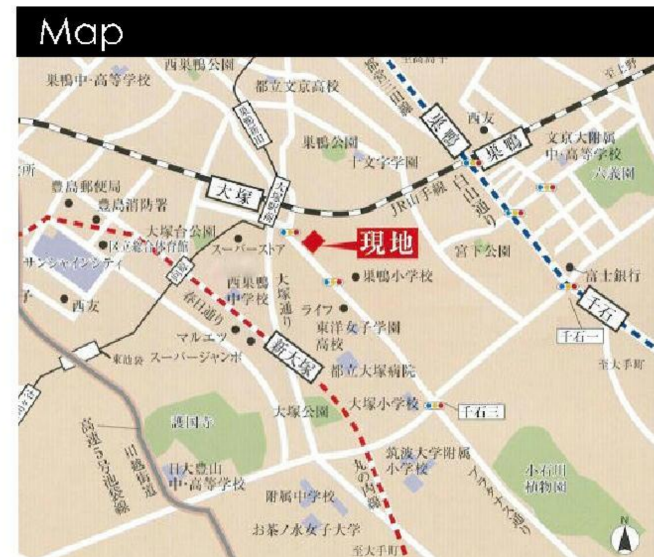
図面と現況が相違する場合は現況を優先させていただきます。

(社)東京都宅建物取引業協会会員 (社)首都圏不動産公正取引協議会加盟 (社)全国宅建物取引業保証協会会員 東京都知事(2)80266号