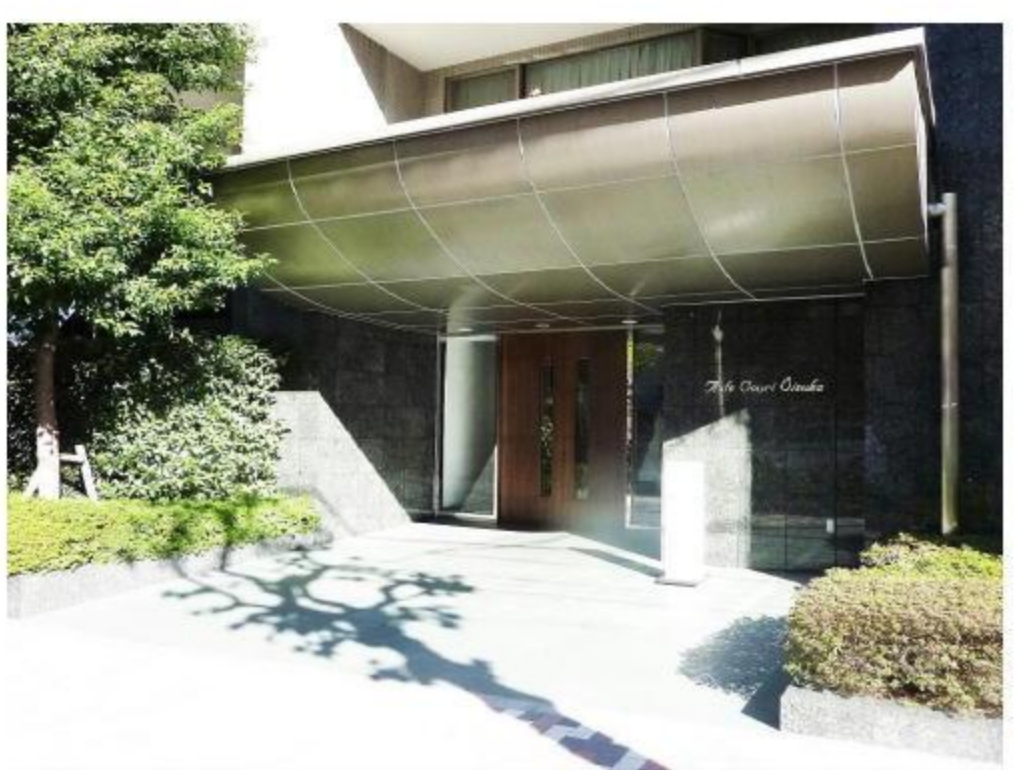
重厚感あふれる表情で迎えるエントランス。