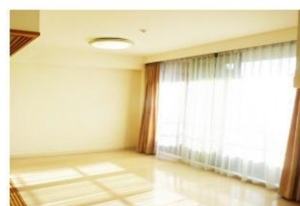
陽光あふれる明るいリビング!