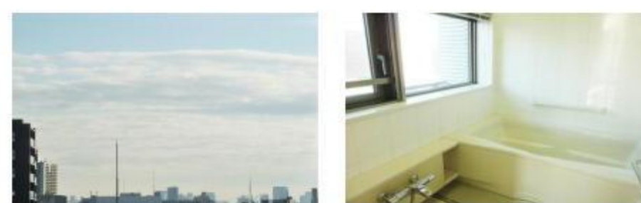
バルコニーから東京タワーが見えます!