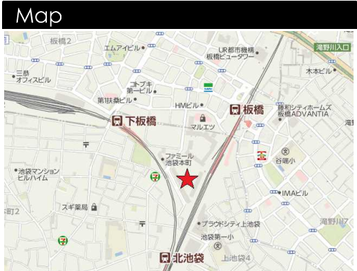
図面と現況が相違する場合は現況を優先させていただきます。

所在地/東京都豊島区池袋本町4-47-12 専有面積/71.05㎡ バルコニー面積 /10.20㎡ ルーフバルコニー面積 /51.40㎡ 建物構造/鉄骨鉄筋コンクリート造地下1階付19階建19階部分 築年月/平成9年3月完成 土地権利/所有権 管理費/10,100円(月額) 修繕積立金/9,450円(月額) ルーフバルコニー使用料/2,600円(月額) その他専用使用料/50円(月額) 町内会費/100円(月額) 管理会社/(株)大京アステージ 現況/居住中 管理形態/全部委託(日勤管理) 駐輪場/200~400円(月額) 引渡/相談 ご内見/可能(事前予約)