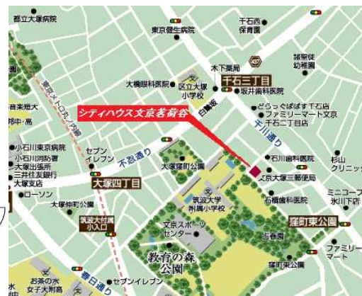
図面と現況が相違する場合は現況を優先させていただきます。

(公社)東京都宅地建物取引業協会会員 (公社)首都圏不動産公正取引協議会加盟 (公社)全国宅地建物取引業保証協会会員 東京都知事(4)80266号