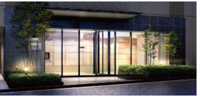
シックで落ち着いた色合いのエントランス