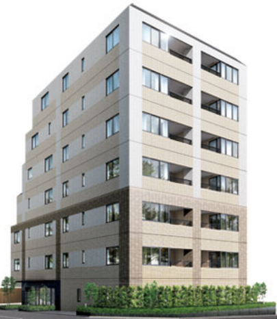
歴史ある文京の地に佇む新築高級マンション