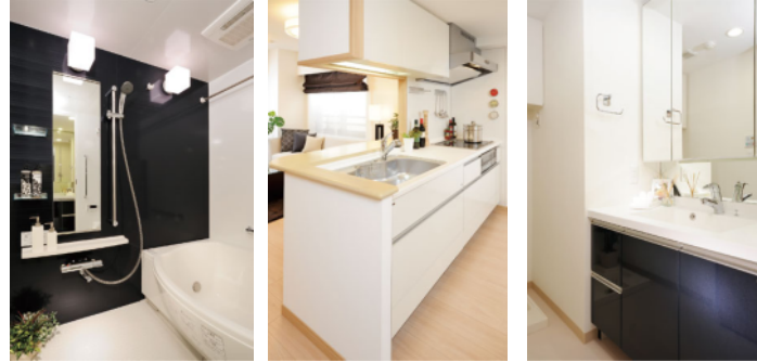
サーモフロア使用の浴室! 広々カウンターキッチン! 三面鏡付洗面化粧台!

浴室乾燥機付24時間換気システム! 高級感のある三面鏡付洗面化粧台! 浄水器付システムキッチン! 人造大理石カウンタートップ! ハンタッチ式エントランスキー! カラーモニター付オートロック! ペアガラスサッシ! プッシュプル玄関ドア! 宅配BOX!