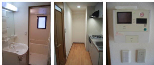
上部掲載の写真は、同マンション別室の写真でございます。

東京・山手エリアの軽快アクセスを手に入れる。 山手線・大塚駅歩5分の大型1Kタイプ!山手線内側! 楽器演奏やDVDシアターも気兼ねなく楽しめる防音対策マンション!