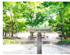
文京区立大塚公園徒歩5分