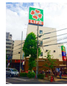
スーパーライフ徒歩2分