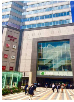
駅前南口再開発も終わりキレイになった大塚駅