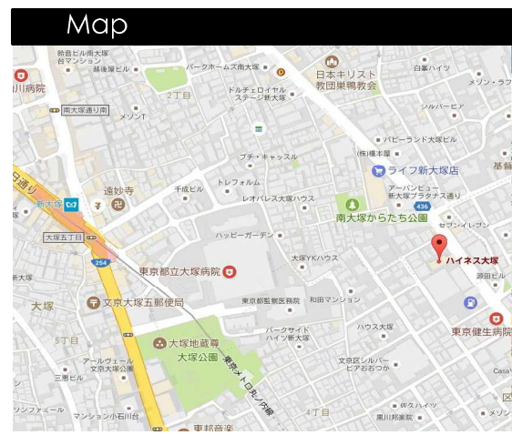
図面と現況が相違する場合は現況を優先させていただきます

物件概要 所在地/東京都豊島区南大塚2-1-10 専有面積/40.74m 2 バルコニー面積 /5.4m 2 建物構造/鉄骨鉄筋コンクリート造6階建4階部分 築年月/昭和50年3月完成 土地権利/所有権 管理費/14,100円(月額) 修繕積立金/10,190円(月額) 管理会社/ハインス管理株式会社 管理形態/全部委託 現況/空室 (※居室内の写真は H21.4 月に撮影したものです。尚、家具・備品は含まれません。)