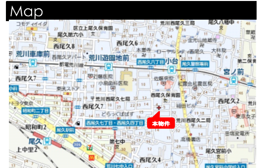
図面と現況が相違する場合は現況を優先させていただきます。