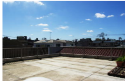
南向きの陽当りの良いルーフバルコニー。東京スカイツリーが見えます!

1F~3Fまで エレベーター付! カラーTVモニター付インターホン! オートロック! 食洗機付システムキッチン! (エレベーターの年間保守をご希望の場合、保守料が年 57,750円がかかります。)