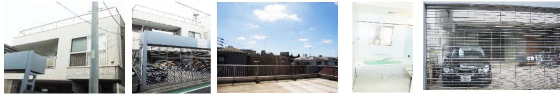
タイル貼りの外観 リモコンで開閉ができる電動シャッター付。 陽当り良好。 窓付の広くて明るいバスルーム! カースペースは車が3台駐車できます。

Access 宇都宮線 尾久駅 徒歩9分 高崎線 小台駅 徒歩4分 都電荒川線 価格 12,000万円