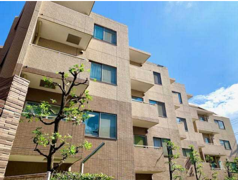
プラタナス通りから一步入った閑静な住環境！