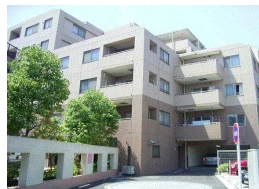
角地に行む、角住戸中心のフォルム