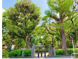
文京区立大塚公園