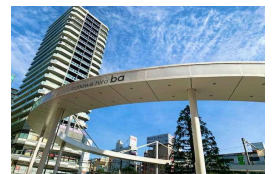
未来的な雰囲気のある大塚駅北口