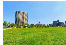
芝生の上で大の字になれる公園「IKE SUN PARK」