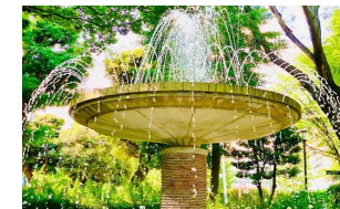
文京区立大塚公園(公園内には区立図書館もあります)